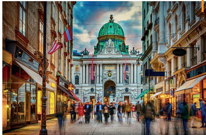
Viena - Áustria

NOTA: Os passeios panorâmicos terminam no centro das cidades de forma a potenciar o aproveitamento dos tempos livres. Passeie ao seu ritmo, desfrute daquele restaurante sugerido por seu guia ou visite um monumento ou museu ao seu gosto. Mais tarde regresse ao hotel em horário da sua preferência (o regresso será por conta do passageiro).