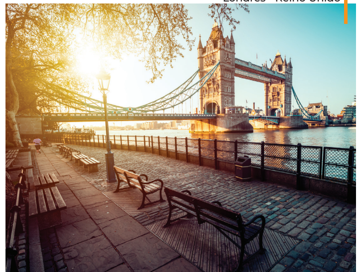
Londres - Reino Unido

NOTA: Os passeios panorâmicos terminam no centro das cidades de forma a potenciar o aproveitamento dos tempos livres. Passeie ao seu ritmo, desfrute daquele restaurante sugerido por seu guia ou visite um monumento ou museu ao seu gosto. Mais tarde regresso ao hotel em horário da sua preferência (o regresso será por conta do passageiro).