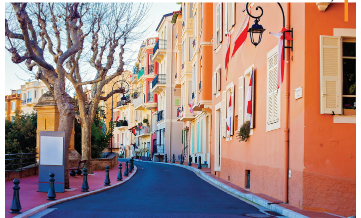
Mônaco - França

NOTA: Os passeios panorâmicos terminam no centro das cidades de forma a potenciar o aproveitamento dos tempos livres. Passeie ao seu ritmo, desfrute daquele restaurante sugerido por seu guia ou visite um monumento ou museu ao seu gosto. Mais tarde regresse ao hotel em horário da sua preferência (o regresso será por conta do passageiro).