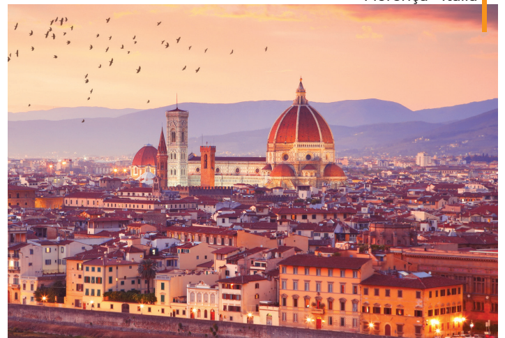
Florença - Itália

NOTA: Os passeios panorâmicos terminam no centro das cidades de forma a potenciar o aproveitamento dos tempos livres. Passeie ao seu ritmo, desfrute daquele restaurante sugerido por seu guia ou visite um monumento ou museu ao seu gosto. Mais tarde regresse ao hotel em horário da sua preferência (o regresso será por conta do passageiro).