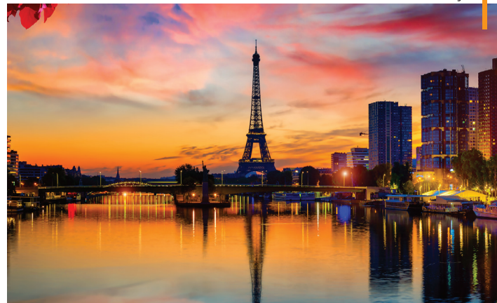
Paris - França

NOTA: Os passeios panorâmicos terminam no centro das cidades de forma a potenciar o aproveitamento dos tempos livres. Passeie ao seu ritmo, desfrute daquele restaurante sugerido por seu guia ou visite um monumento ou museu ao seu gosto. Mais tarde regresse ao hotel em horário da sua preferência (o regresso será por conta do passageiro).