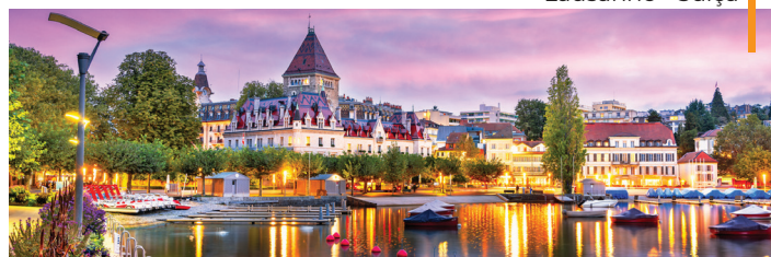
Lausanne - Suíça

NOTA: Os passeios panorâmicos terminam no centro das cidades de forma a potenciar o aproveitamento dos tempos livres. Passeie ao seu ritmo, desfrute daquele restaurante sugerido por seu guia ou visite um monumento ou museu ao seu gosto. Mais tarde regresse ao hotel em horário da sua preferência (o regresso será por conta do passageiro).